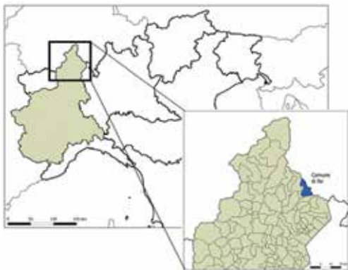
Figura 1. Inquadramento geografico dell'area. sistema di riferimento ED50, UTM Zone 32N.

Il caso di studio è rappresentato da un soprassuolo forestale comunale, parte di un comprensorio forestale-pascolivo denominato Vacchereggio, sito nel Comune di Re, in alta val Vigizzo (VB). L'amministrazione di quest'area è stata recentemente affidata ad un Consorzio agrosilvopastorale, costituitosi tra Comune e proprietari privati, al fine di promuovere la gestione forestale.