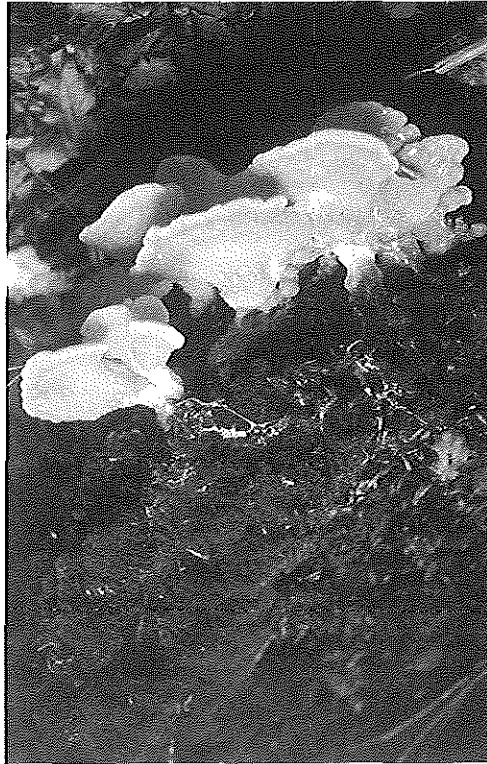
Foto 4 - All'abbondanza di legno morto nelle riserve integrali è dovuta la ricchezza di insetti e di funghi decompositori. Nella foto carpofori di Polyporus sulfureus (Bull) Fr, saprofita del durame della quercia.

La facoltà germinativa delle ghiande di quercia, la cui produzione inizia verso i 60-80 anni, resta elevata anche nelle piante molto vecchie. Sotto una quercia di 450 anni sono state raccolte ghiande con una facoltà germinativa del 90%, in genere si mantiene sul 60-70%. Il faggio invece sem-