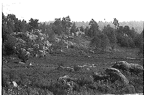
Foto 2 - Una associazione tipica di platière , con pini, betulle e cailuna (foto Wolynski).

dei settori umidi il cui prosciugamento fu ripetutamente tentato dal 1883 al 1842.