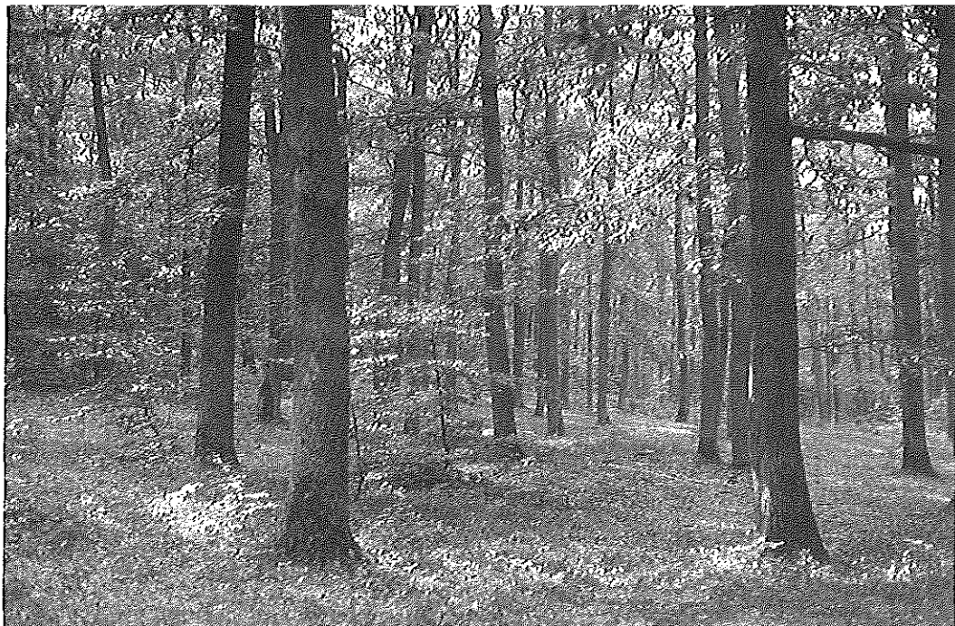
Foto 3 - Popolamento di quercia in fase di rinnovazione.

Le conifere sono ben rappresentate nella foresta, ma sempre di origine artificiale. Il pino marittimo era stato introdotto già nel 1590 e pare fosse molto diffuso fino al