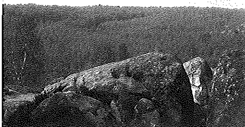
Foto 1 - In primo piano alcuni caratteristici blocchi di arenaria; sullo sfondo una delle elevazioni che ospitano i migliori popolamenti della foresta.

re di Beauce, permisero il consolidamento e la conservazione, nelle sue grandi linee, di questo rilievo mammellonato fino al giorno d'oggi. Nel Quaternario le glaciazioni scolpirono la piattaforma calcarea mettendo a nudo i banchi di arenaria che, fortemente fessurati, persero localmente il sostegno degli strati di sabbia sottostanti, e crollando lungo i versanti formarono i caratteristici chaos de rochers , oggi una delle mete preferite dei rocciatori parigini.