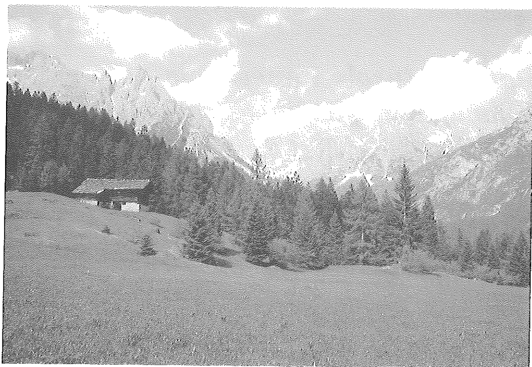
Val Canali in Primiero.