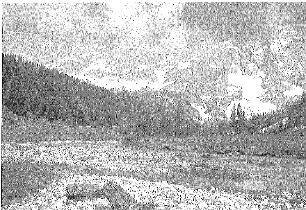
Aspetti naturalistici della Val Venegia.