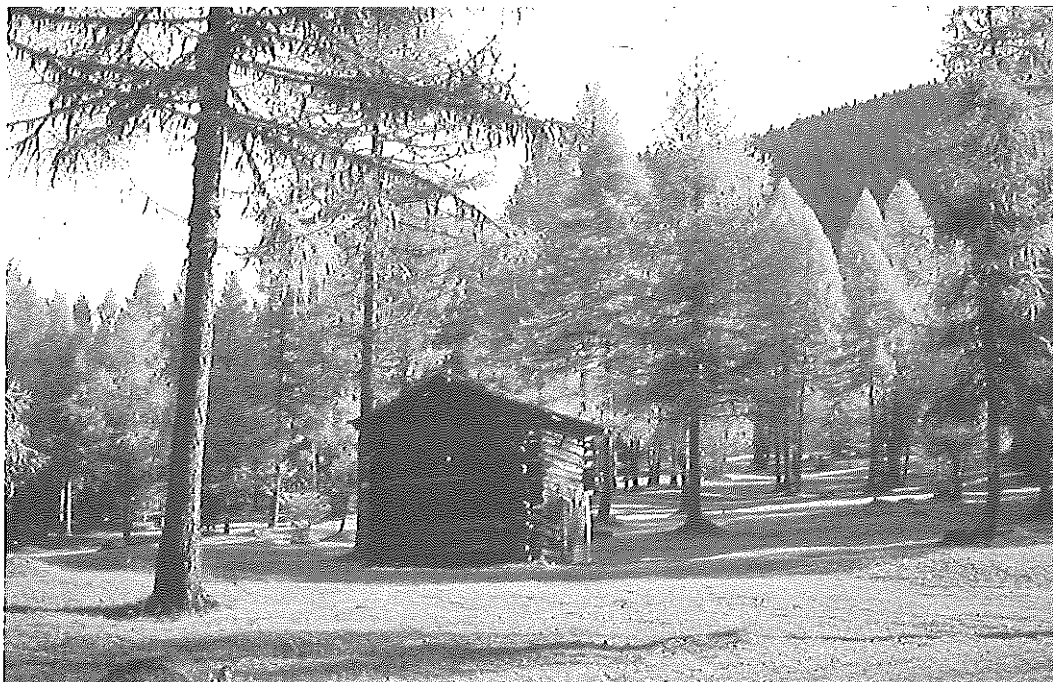
I prati alberati a larice della Val Campo di Dentro. Per il mantenimento di questo particolare quadro paesaggistico vengono concessi contributi ai contadini.

provinciale. Questo è uno dei punti d'attrito più evidenti con una parte almeno delle associazioni ambientaliste e materia di contendere e d'interpretazione legale fra Stato e Provincia, anche alla luce di alcune sentenze in materia di attività venatoria all'interno di zone tutelate.