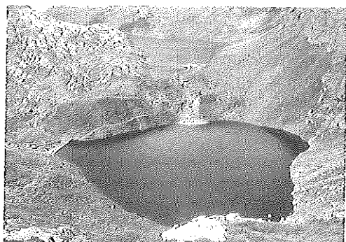
Il Lago Verde, uno dei laghi della Valle di Sopranes nel cuore del Parco naturale «Gruppo di Tessa».

la legge prevede che per ogni parco venga istituito un Comitato di gestione composto: